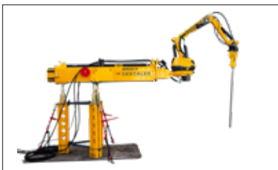
Hydraulhammare i bilder: BHB 55 Last- och stabilitetsdiagram finns tillgängligt vid förfrågan